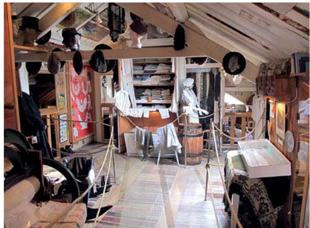
Övre planet med klädförrådet. Foto 2015.

På övre planet eller vinden finns barnens och föräldrarnas sovrum samt förvaringsrum för kläder etc. Det behövdes mycket kläder på långresorna till sjöss och här finns fortfarande travar av ribbstickade långkalsonger och tröjor. Inspunnet i ullen finns dessutom kvinnohår. Då blir nämligen tyget lika varmt antingen det är torrt eller vått. Under det stora förvaringsskåpet för tröjorna och kalsongerna står en kista fylld med de vackraste spetsar. Det är Annas brudkista, den som aldrig kom till användning. Anna berättade själv på gamla dar om hur både mormodern, modern och Anna själv suttit och handarbetat: ”Där har jag och mamma och mormor virkat under alla år, te vecka nötta va’ de?”